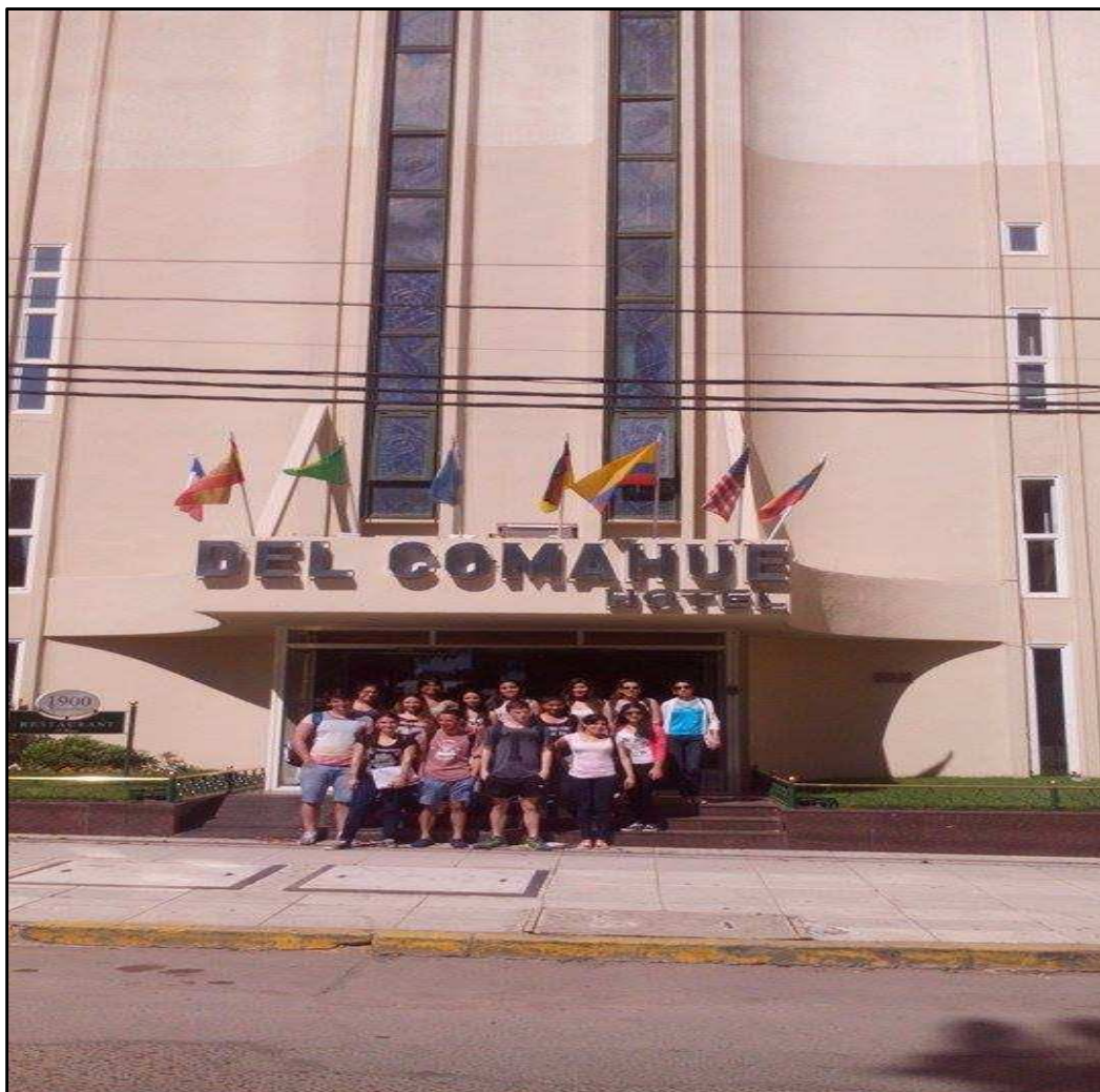
Hotel del COMAHUE – Ciudad de Neuquén