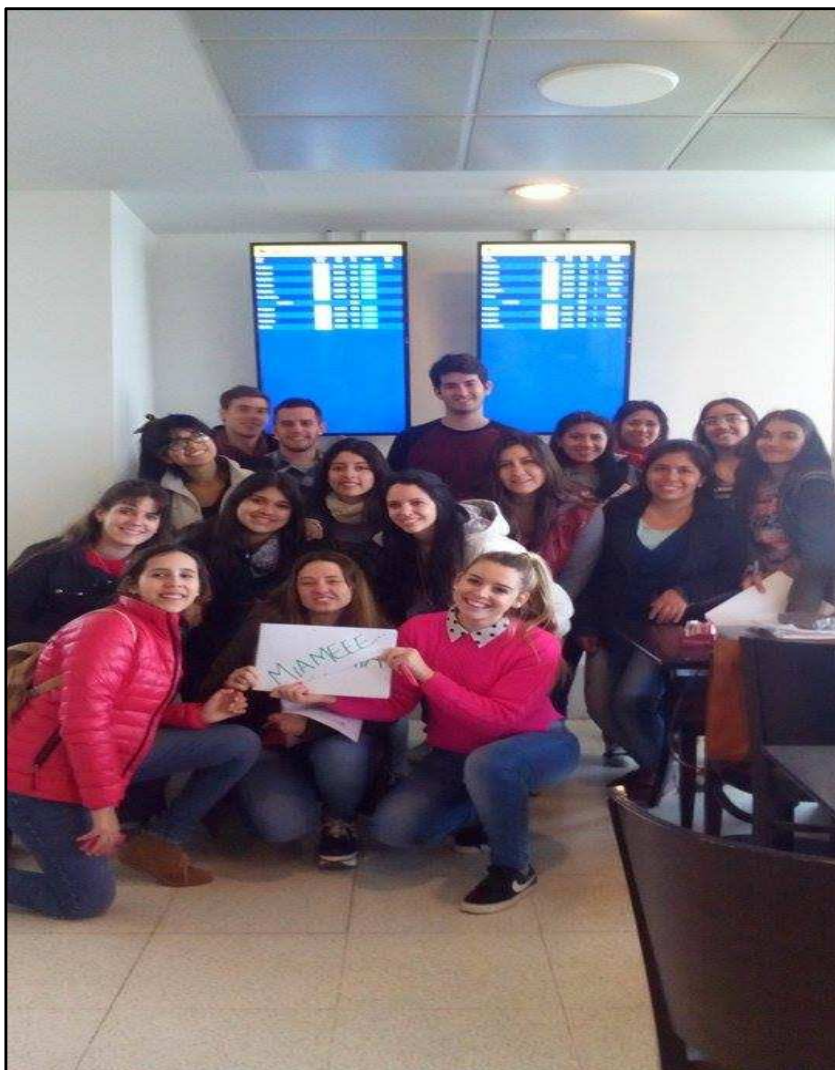
Salida Aeropuerto Internacional del Neuquén